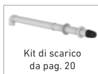
Kit di scarico da pag. 20