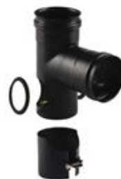
Raccordo a T