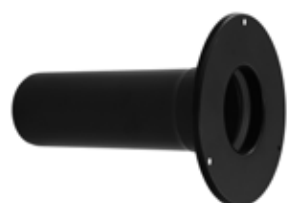
Rosone passaggio muro