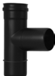
Raccordo a T