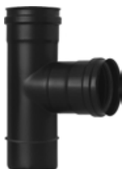
Raccordo a T